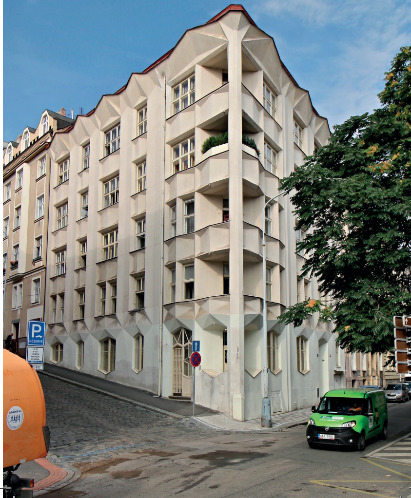
JOSEF CHOCHOL, DŮM V NEKLANOVĚ ULICI, PRAHA, 1914