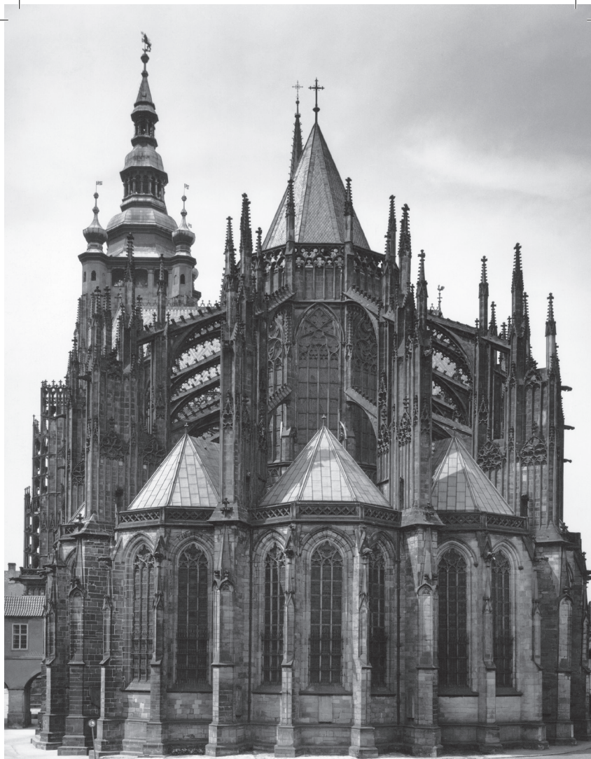
KATEDRÁLA SVATÉHO VÍTA, VÁCLAVA A VOJTĚCHA, PRAHA, 1344 – 1929