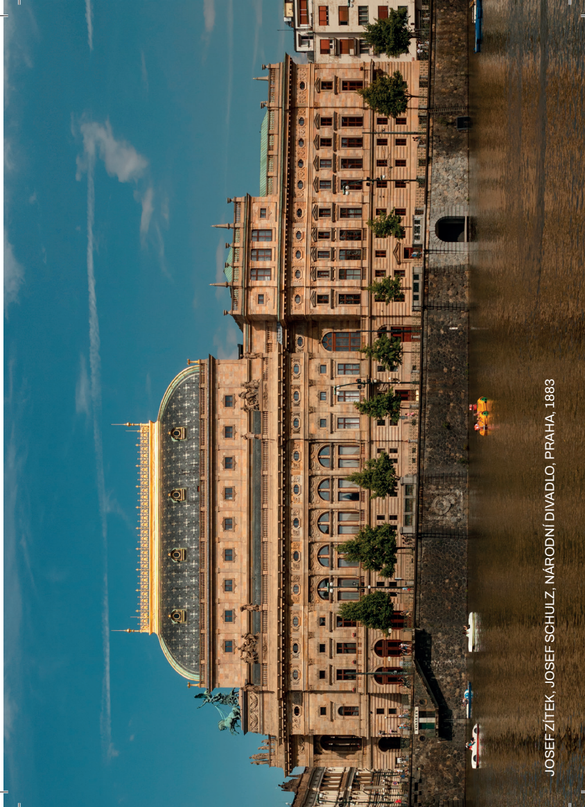
JOSEF ZÍTEK, JOSEF SCHULZ, NÁRODNÍ DIVADLO, PRAHA, 1883