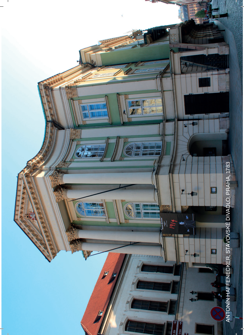
ANTONÍN HAFFENECKER, STAVOVSKÉ DIVADLO, PRAHA, 1783