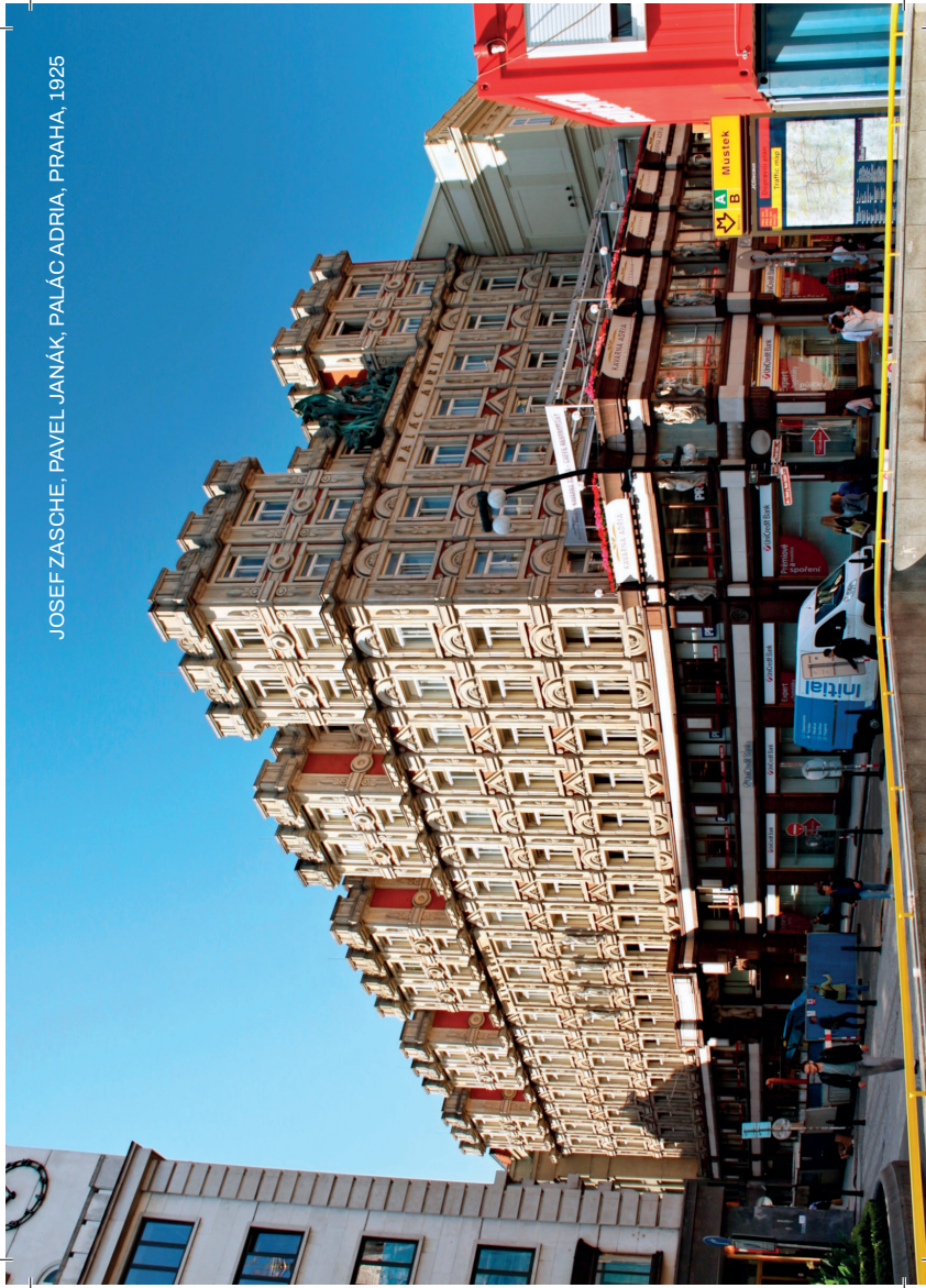
JOSEF ZASCHKE, PAVEL JANÁK, PALÁC ADRIA, PRAHA, 1925