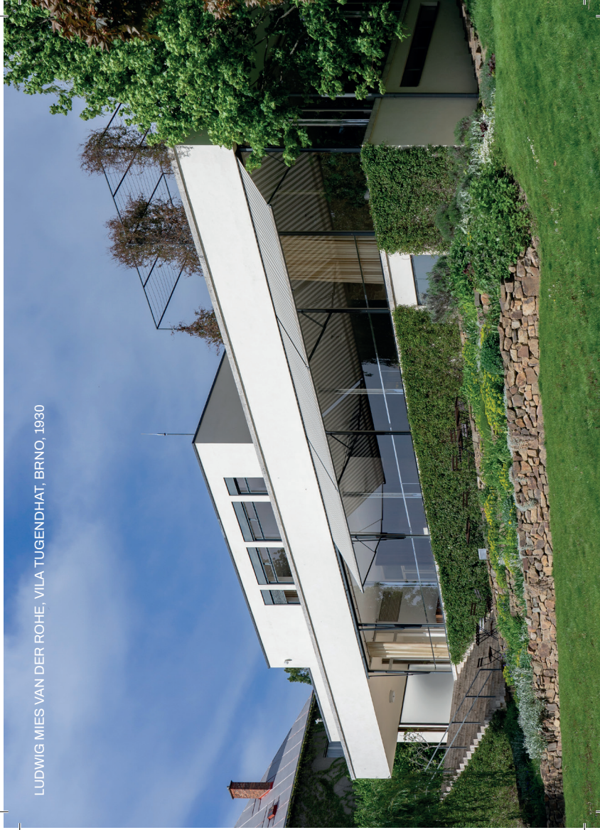
LUDWIG MIES VAN DER ROHE, VILA TUGENDHAT, BRNO, 1930