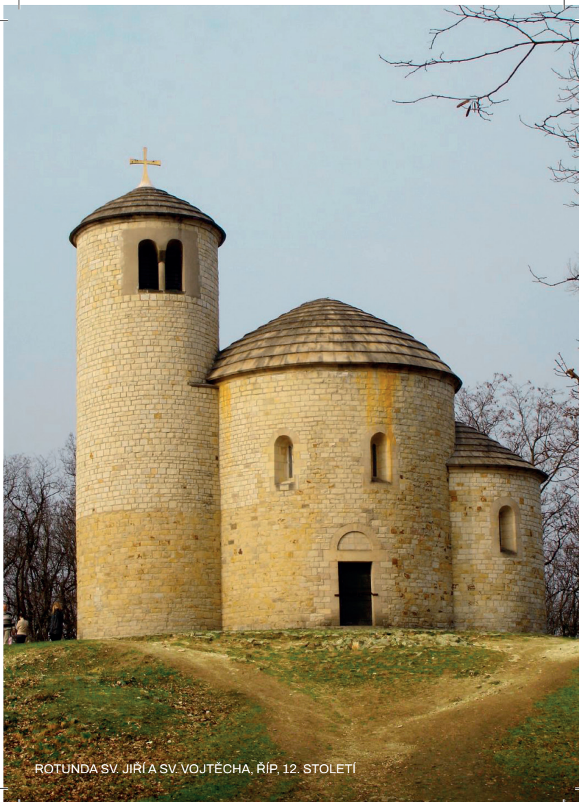
ROTUNDA SV. JIŘÍ A SV. VOJTĚCHA, ŘÍP, 12. STOLETÍ