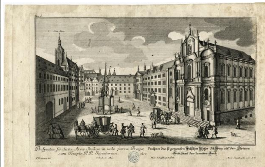
Dobová rytina zachycuje horní vlašské, dnešní Malostranské náměstí, kam se do chrámu sv. Mikuláše sjelo 14. prosince 1791 na slavnostní smuteční mši na čtyři tisíce obdivovatelů W. A. Mozarta.