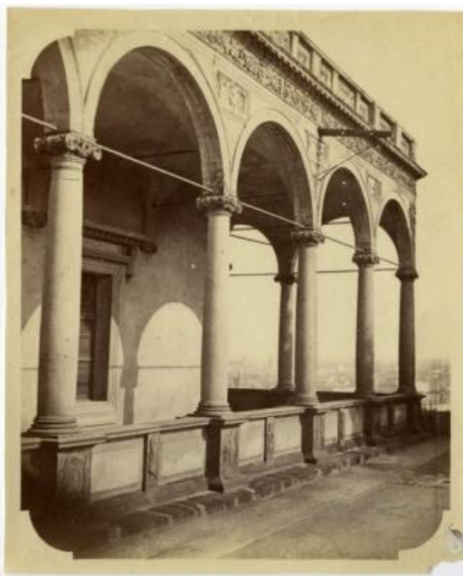
Obr. 2 Sloupové arkády Belvederu